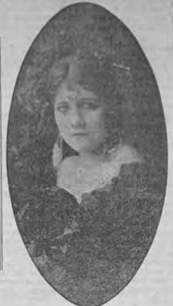
La bella actriz de opereta Elena Laverde recientemente llegada al país que en la próxima corrida dará la nota de color y alegría saliendo cabalgando brioso corcel, a solicitar la lluvia, a la clásica usanza española.